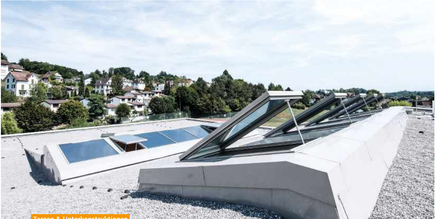
Zargen & Unterkonstruktionen

Die Glaskonstruktion PR60 lässt sich an alle gemäss unseren Angaben erstellten Unterkonstruktionen aus Holz, Beton oder Metall adaptieren. Stahlblechzargen liefern und montieren wir auf Wunsch gleich mit, sie werden bauseitig ausisoliert und abgedichtet. Mit PR60 lassen sich alle klassischen Dachformen wie Pult-, Sattel-, Shed-, Pyramid-, Walm-, Bogen- und Polygondächer realisieren, aber auch freie Formen, angepasst an die Gestaltung der Architektur. Die Profile und Abdeckungen sind in Natur-Aluminium oder mit einer RAL-Farbe beschichtet lieferbar.