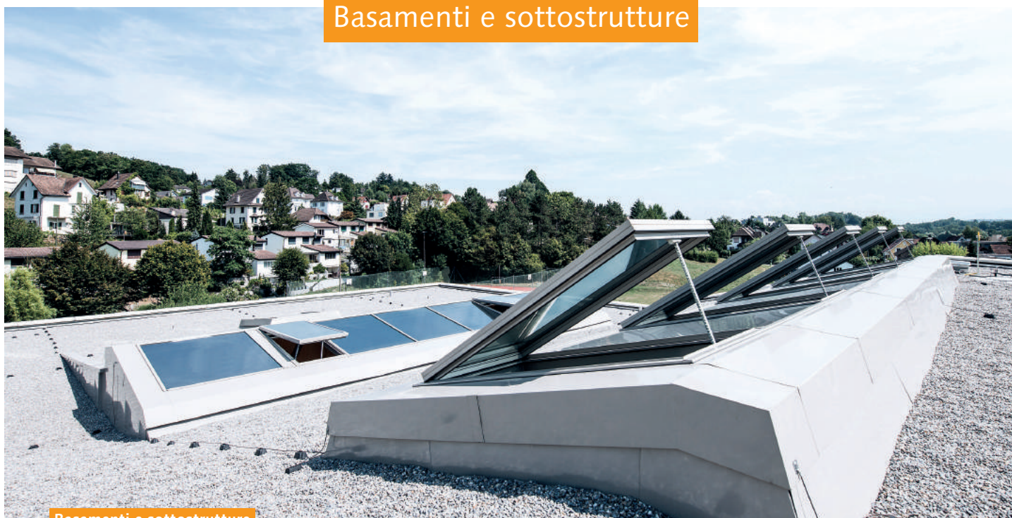
Basamenti e sottostrutture

La costruzione in vetro PR60 può essere modulata in base a tutte le sottostrutture elaborate in legno, cemento o metallo in base alle nostre specifiche. Su richiesta, forniamo e assembliamo basamenti in lamiera d'acciaio che vengono isolati e sigillati sul posto. Il PR60 può essere impiegato per creare qualsiasi forma di tetti classici, quali ad esempio tetti a spiovente, tetti a due falde, alla greca, piramidali, a padiglione, ad arco e tutti i tetti poligonali, nonché forme a piacere e modulate in base al concept architettonico. I profili e le coperture sono disponibili in alluminio naturale o termolaccato con colori RAL o NCS o altri.