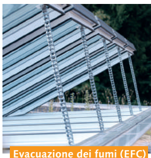
Evacuazione dei fumi (EFC)

In caso d'incendio, le ribalte semplici o doppie consentono al calore e ai fumi tossici di fuoriuscire garantendo l'accessibilità delle uscite d'emergenza. Un sistema automatico da 24 V indipendente controlla i motori del mandrino e della catena o i sistemi di azionamento pneumatico. Conforme alla norma EN 12101-2, sono possibili anche soluzioni personalizzate certificate.